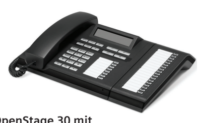
OpenStage 30 mit OpenStage-Tastenmodul 15